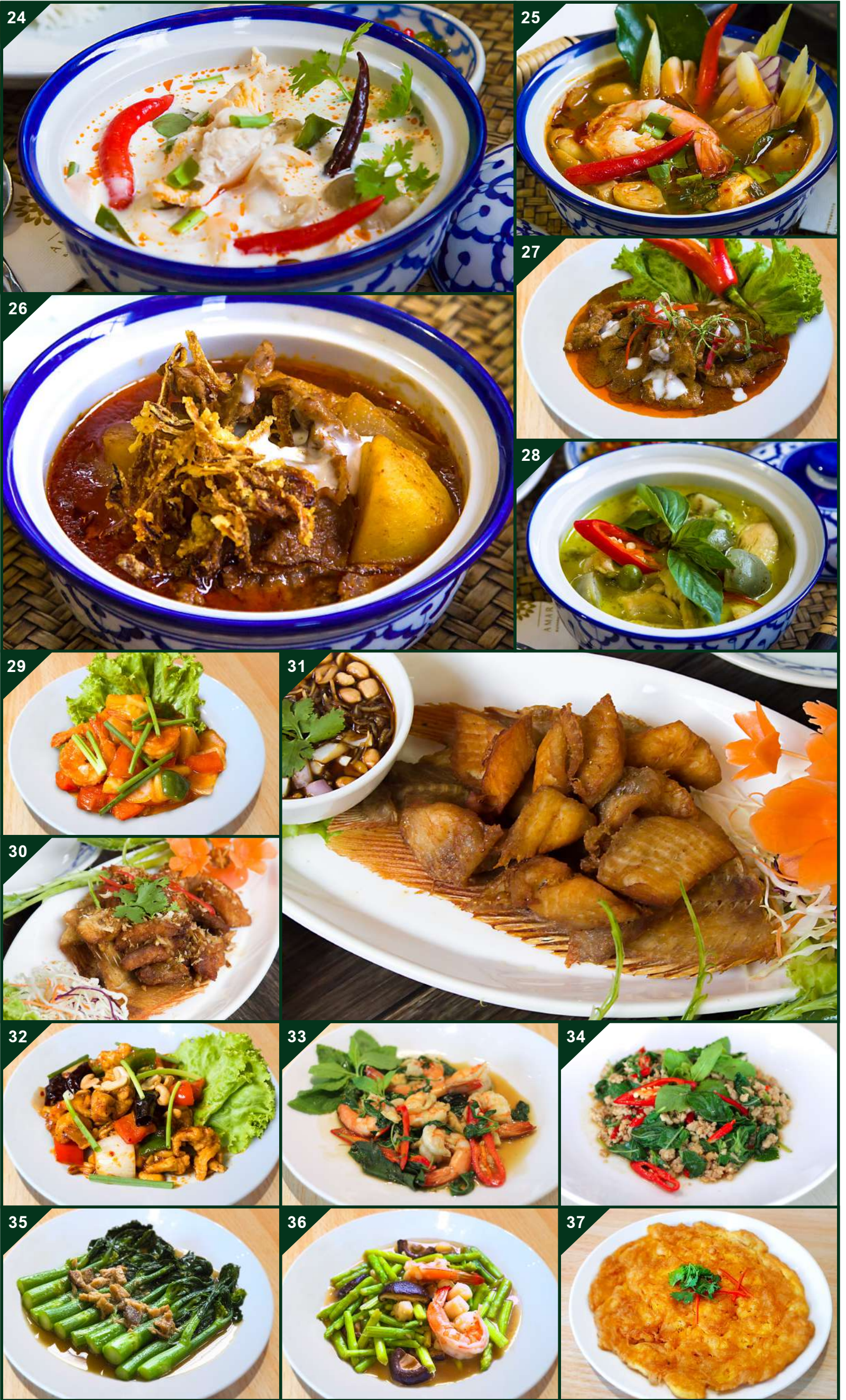
ภาพอาหารที่ใช้ประกอบการโฆษณาเท่านั้น ALL PHOTOS FOR COMMERCIAL USE ONLY